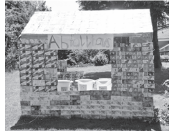
Nachhaltiger Unterricht: Das Abfallhaus im Schulhaus Buck.