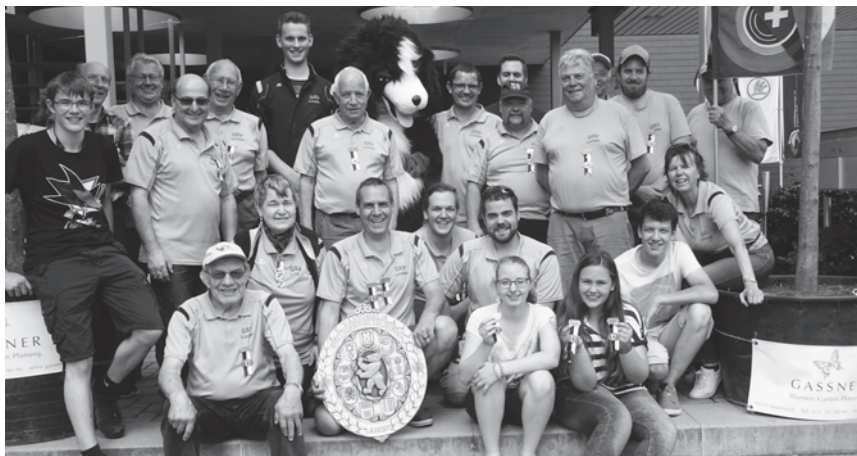
Die Lindauer Schützengruppe mit «Maskottchen» Sennenhund.

durch die Hauptgasse in Appenzell zu schlendern oder einen Jass im Festzentrum zu klopfen. Von allen Seiten wurde bestätigt, dass alles, d.h. von A (wie A-Scheibe) bis Z (wie Zielwasser) vorbildlich organisiert war. Auch wenn nicht alle ihr persönliches Ziel erreichten, war es ein toller Tag. Schade nur, dass jeder tolle Tag einmal zu Ende geht.