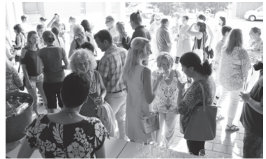
Apéro am Jahresschluss der Schule Lindau.

Beim Apéro begrüßte der Schulpräsident alle Anwesenden mit einer kurzen Ansprache und stellte auch gleich alle neuen Gesichter an der Schule Lindau vor.