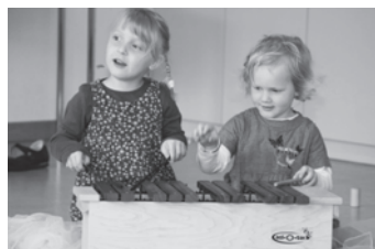
Früh übt sich...

Wallisellen, Bahnhofstrasse 13, Mittwoch, 9.30 bis 10.30 Uhr, 24. August und 31. August (Leitung K. Schweers) Illnau, Singsaal Hagen, Mittwoch, 9.30 bis 10.30 Uhr, 24. August und 7. September (Leitung: P. Jucker)