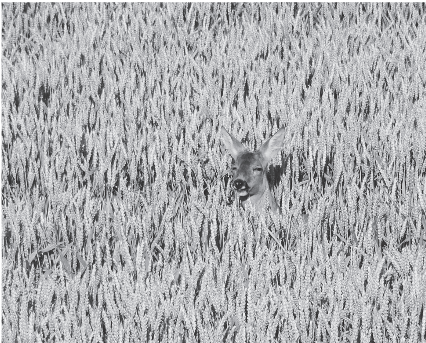
Sonnenbad in Tagelswangen.