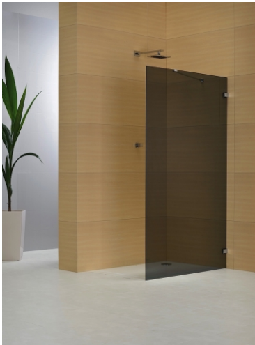
Abb.: PE 8WZ-V